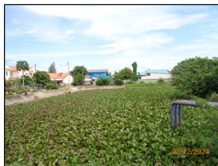
บ่อหนองน้ำ