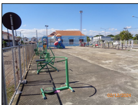
สนามเด็กเล่น