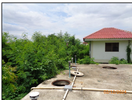
ระบบบำบัดน้ำเสีย