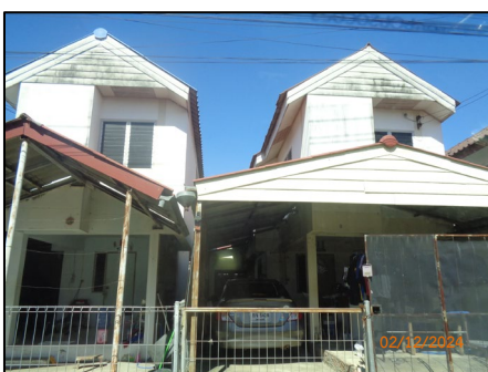
บ้านเดี่ยว 2 ชั้น