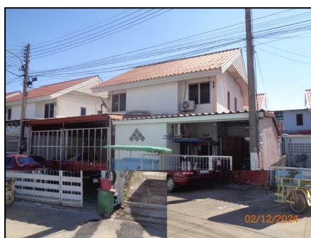
บ้านแฝด 2 ชั้น