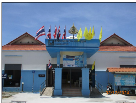
อาคารศูนย์ชุมชน