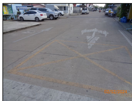
สภาพถนนภายในโครงการ